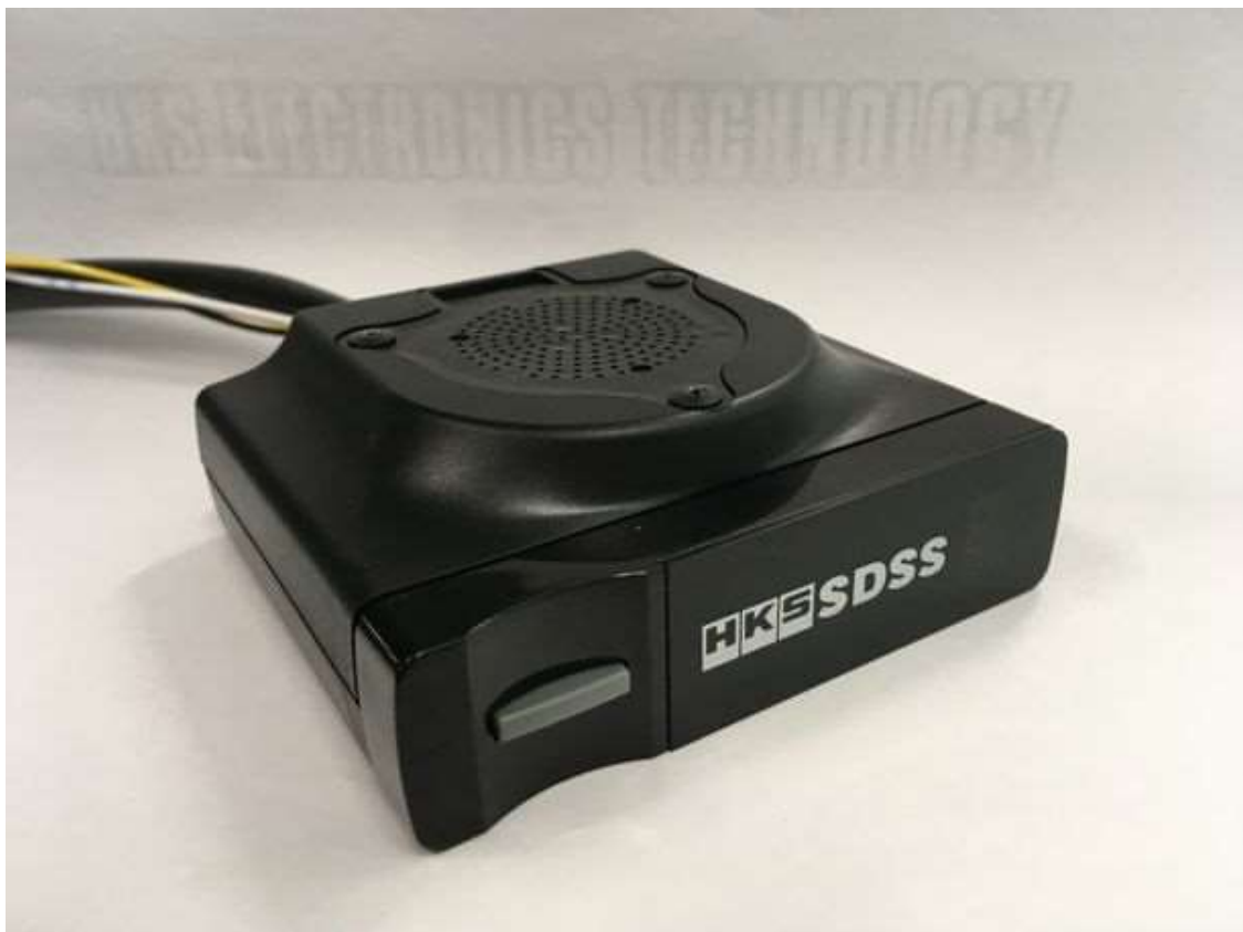
安全運転支援装置