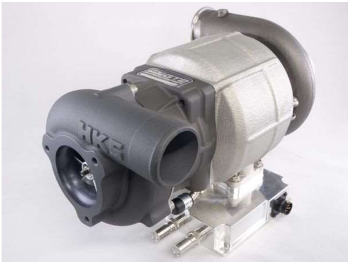
増速機付き電動過給機

(1)TURBO GENERATOR(排気回生装置) (2)増速機付き電動過給機(Traction Drive増速式) をご紹介いたします。