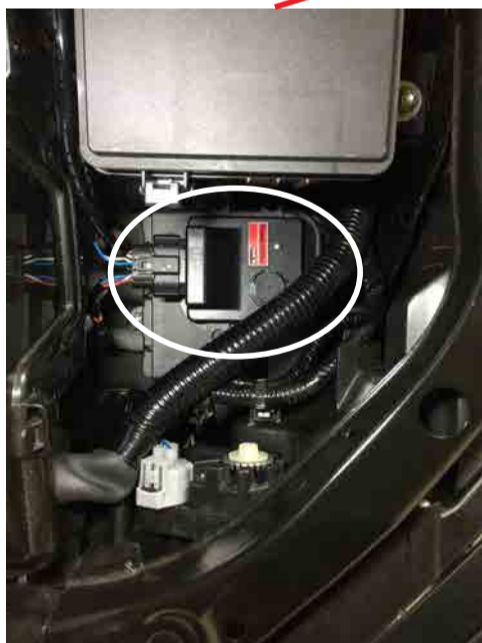
Power Editor 本体の設置推奨位置 Power Editor 本体を設置・固定