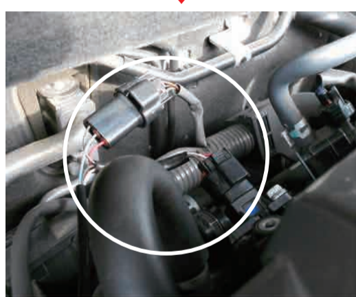
Power Editor ハーネスを割込み接続