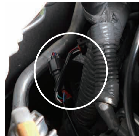
Power Editor ハーネスを割込み接続