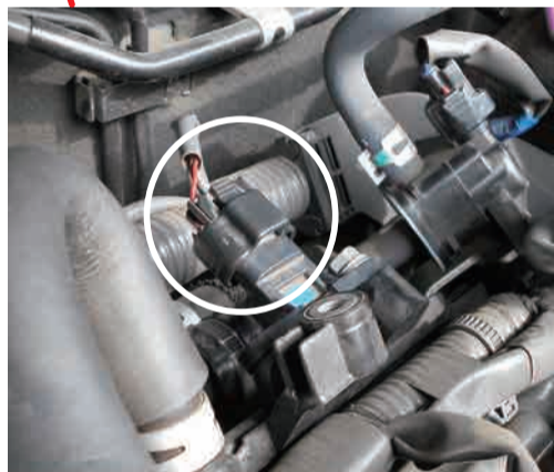
圧力センサ位置 (チャンネル 2 側)