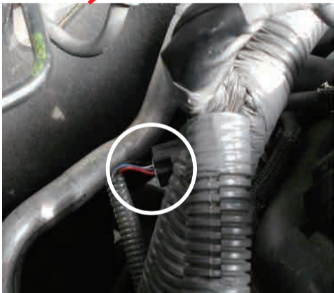
圧力センサ位置 (チャンネル 1 側)