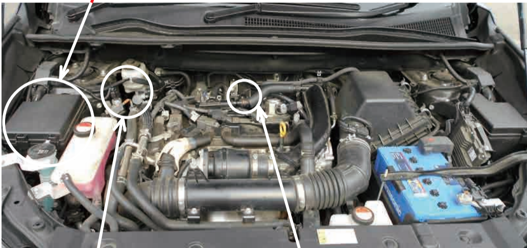
視点 (奥を覗き込んでください)