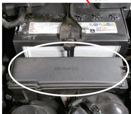
Power Editor 本体の設置推奨位置