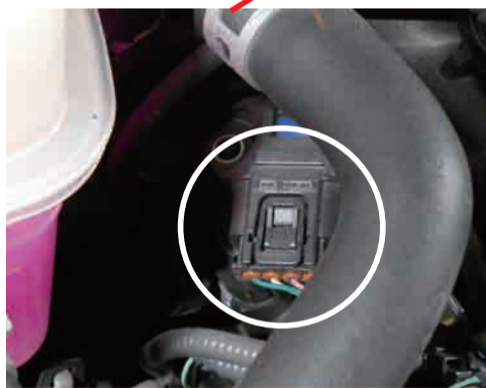
圧力センサ位置（チャンネル1側）