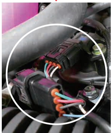
Power Editor ハーネスを割込み接続