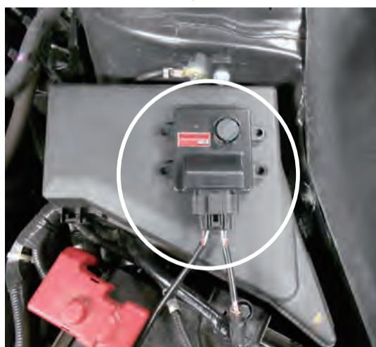
Power Editor 本体を設置・固定