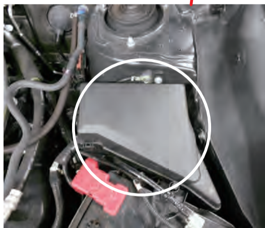
Power Editor 本体の設置推奨位置